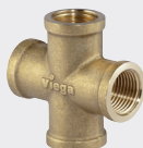
Racord în cruce - alamă - filet Rp model 1632